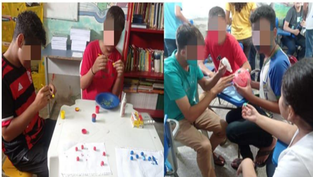
Figura 2A: Construção dos modelos atômicos de Dalton e Thomson

No segundo momento, os estudantes foram organizados em quatro grupos para construção dos modelos didáticos (Figuras 2A e 2B). A construção dos modelos favoreceu o entendimento da estrutura atômica, a aprendizagem colaborativa e a aplicação dos conceitos estudados de forma criativa e significativa. Esse resultado vai ao encontro do que afirma Zierer (2017), ao destacar que a construção de modelos didáticos possibilita momentos agradáveis de descontração e espontaneidade, que contribui para um processo de ensino e aprendizagem criativo e interativo, permitindo ao estudante compreender, ampliar e reconstruir os conhecimentos científicos teóricos abordados em sala. Os modelos construídos pelos estudantes são apresentados na figura 3.