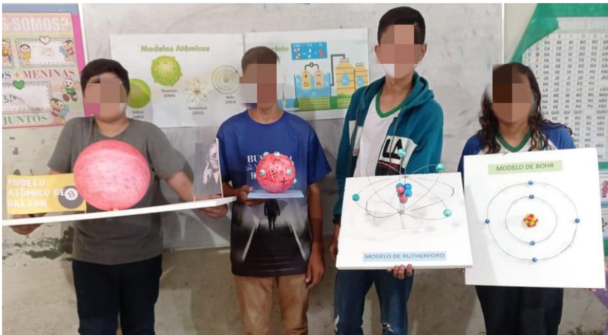
Figura 3: Modelos atômicos construídos pelos estudantes