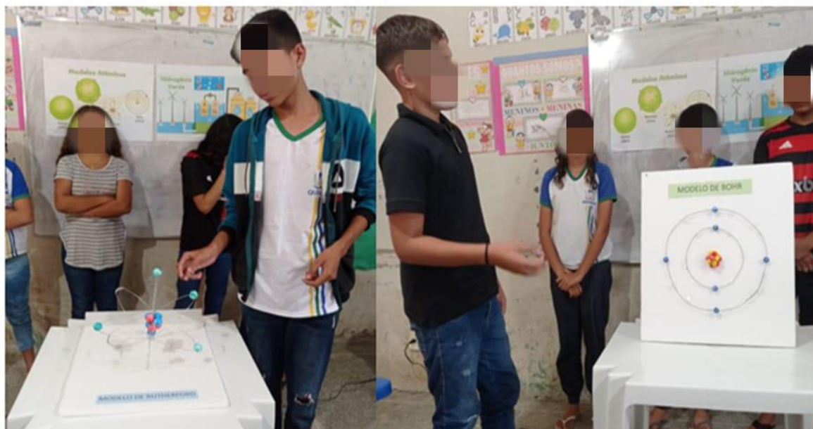
Figura 4B: Apresentação dos modelos atômicos de Rutherford e Bohr