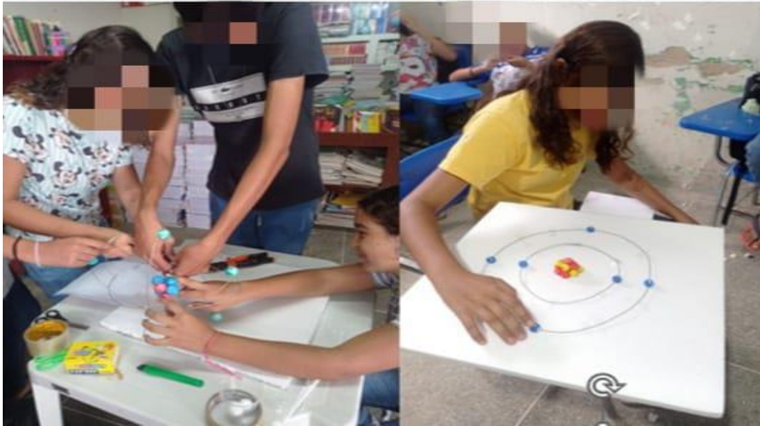
Figura 2B: Construção dos modelos atômicos de Rutherford e Bohr