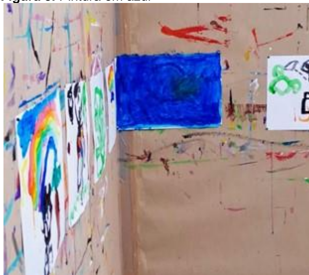
Figura 3. Pintura em azul

Acompanhamos a construção dessa narrativa, onde a criança pintava com entusiasmo, narrando a construção e transformação dos elementos no papel. No entanto, para alguém que não acompanhou o processo, o resultado final poderia ser percebido apenas como uma folha coberta pela cor azul.