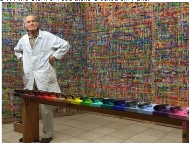
Figura 1: Arno Stern em seu ateliê Closlieu em Paris.